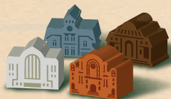
4 dřevěná nádraží