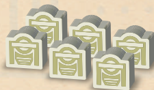
6 dřevěných stanic metra