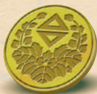
1 kovová císařská pečeť japonské vlády