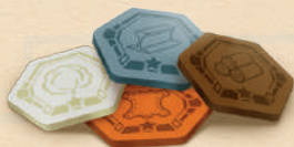
4 dřevěné žetony označení bonusů